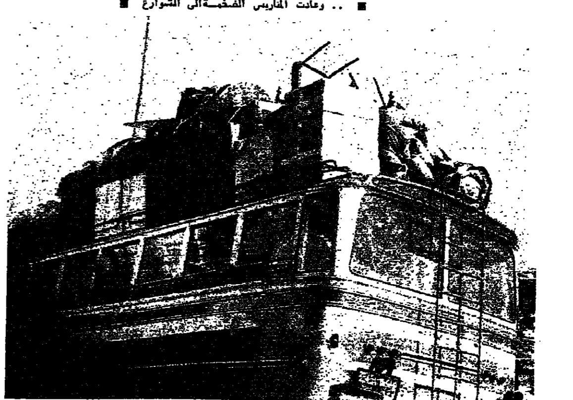
■ نزوح جماعي بالوسط

والد صبا في شيل لم ت مس الل وجد الق الورد الخاز الناط وتين هروبا أ والدين من أ جنت المرقا غوزو التقت لصلح اعلى اقدم في حواجز متر ال النار الرمت الشيا حاجز من و من فر حدهم صفه متجد في الأ الق سليمان للشبان مختلف تفجأ علقه وض شال كائن وقد الات جاط لم ي تجارة